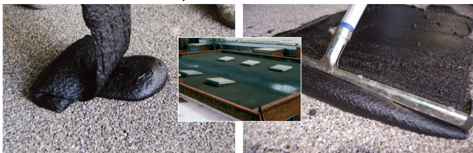
Roofite® Giet & Herstel